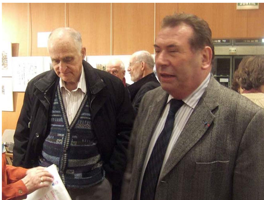
vernissage de l'exposition :