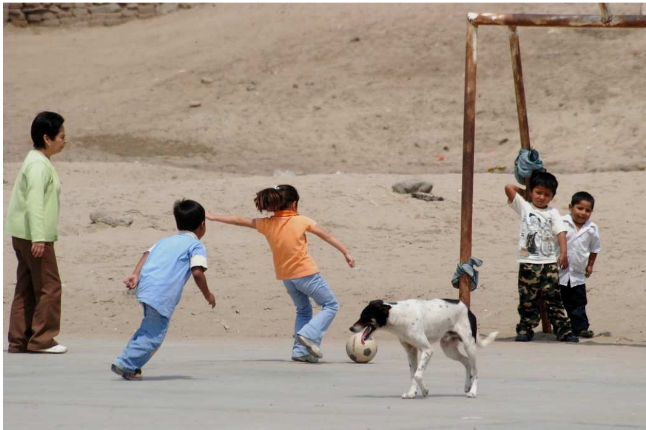
Les enfants jouent au football, devant le centre d'Alto Trujillo (photo d'Alban Eyssette, août 09)

Enfin, les dernières nouvelles du centre La Esperanza nous ont un peu inquiétés, mais le pire a été évité, et les dégâts presque réparés - voir p8 et sur le site.