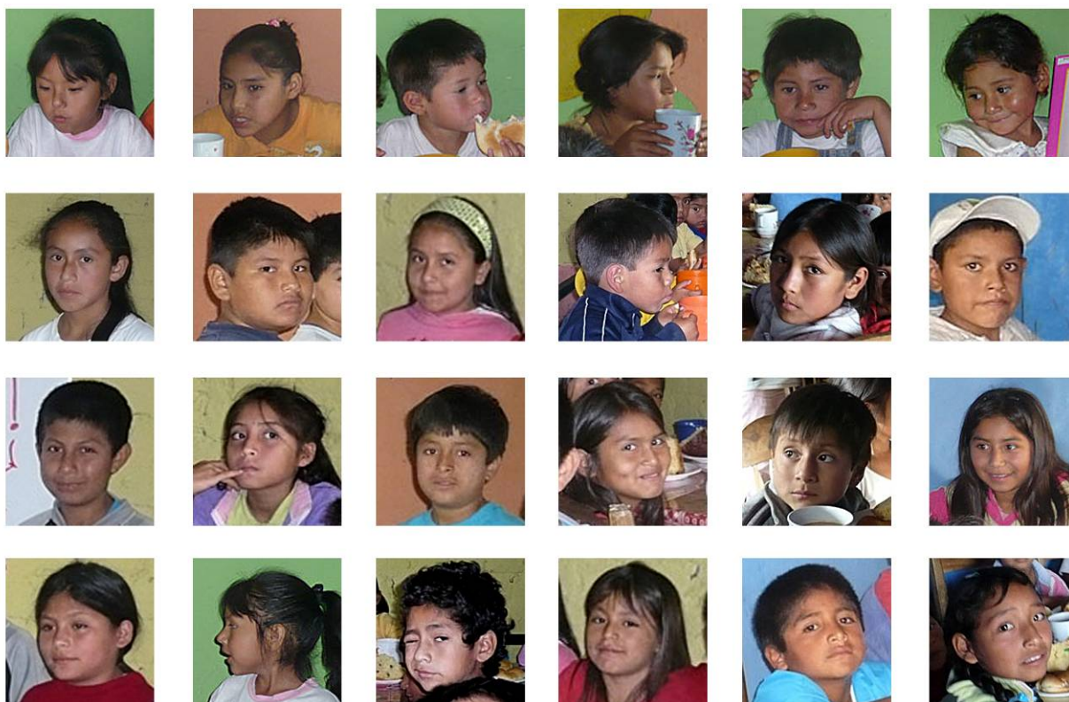
Un échantillon des frimousses des 122 petits péruviens des centres